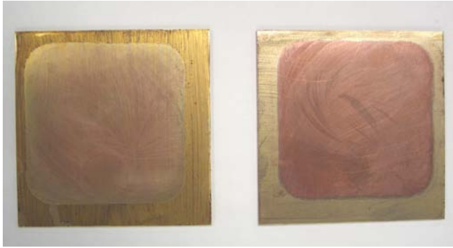
Confronto tra 2 prodotti per la pulizia del rame